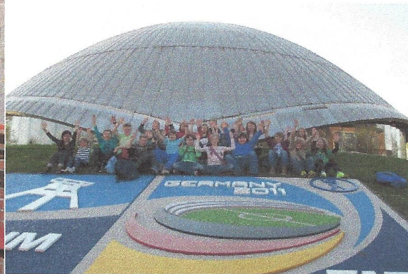
Besuch im Planetarium Bochum