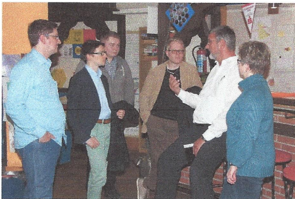
Politik hautnah im TOT - Rhade