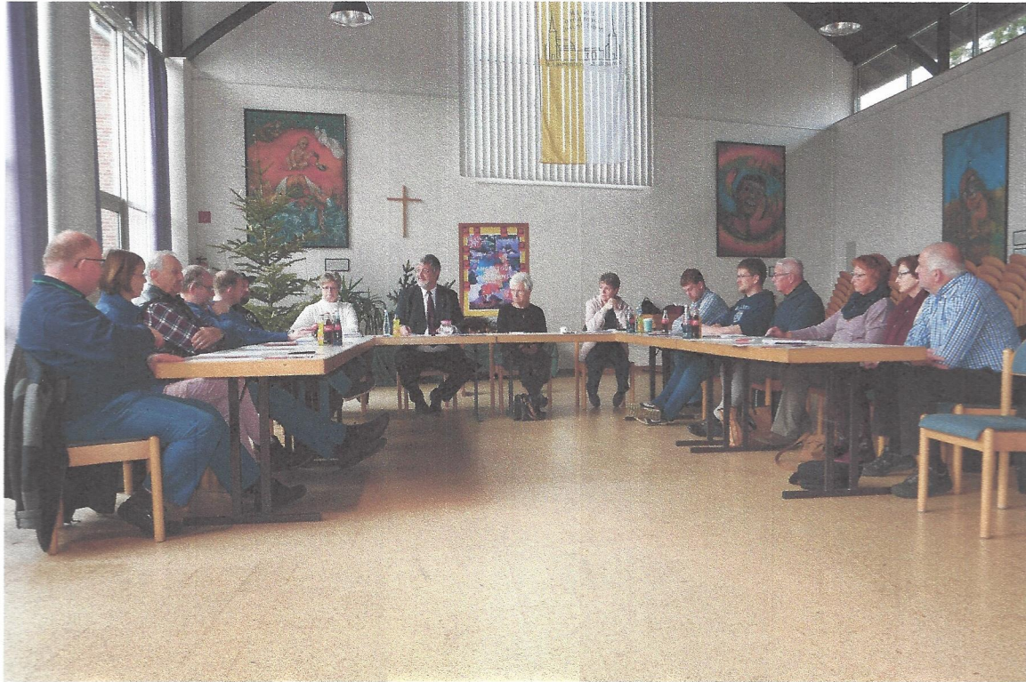
9. Mitgliederversammlung RFJev 14. Januar 2018 CMH